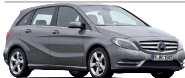
MERCEDES B-KLASSE (Typ W 246)

Die zweite Generation der B-Klasse lässt den Stern über Stuttgart hell funkeln. Der Wagen hat beim TÜV einen glänzenden Auftritt.