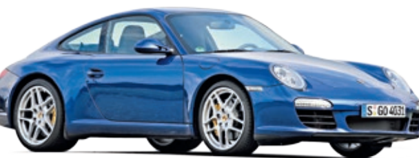
PORSCHE 911 (Typ 997)

Nein, wir haben nicht die Ergebnisse des letzten TÜV-Reports gedruckt: Auch in diesem Jahr ist der Porsche 911 ein Siegertyp, beweist Qualität.