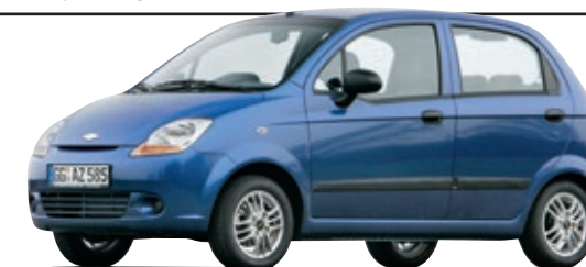
CHEVROLET MATIZ (Typ KLYA/KLAK)

Klein, billig, schlecht – als Schlusslicht in der HU-Statistik nützt auch ein geringer Gebrauchtpreis nichts.