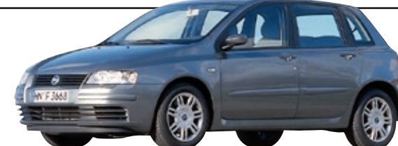
FIAT STILO (Typ 192)

44 Prozent fallen mit erheblichen Mängeln durch, das heißt fast die Hälfte aller vorgeführten Stilo.